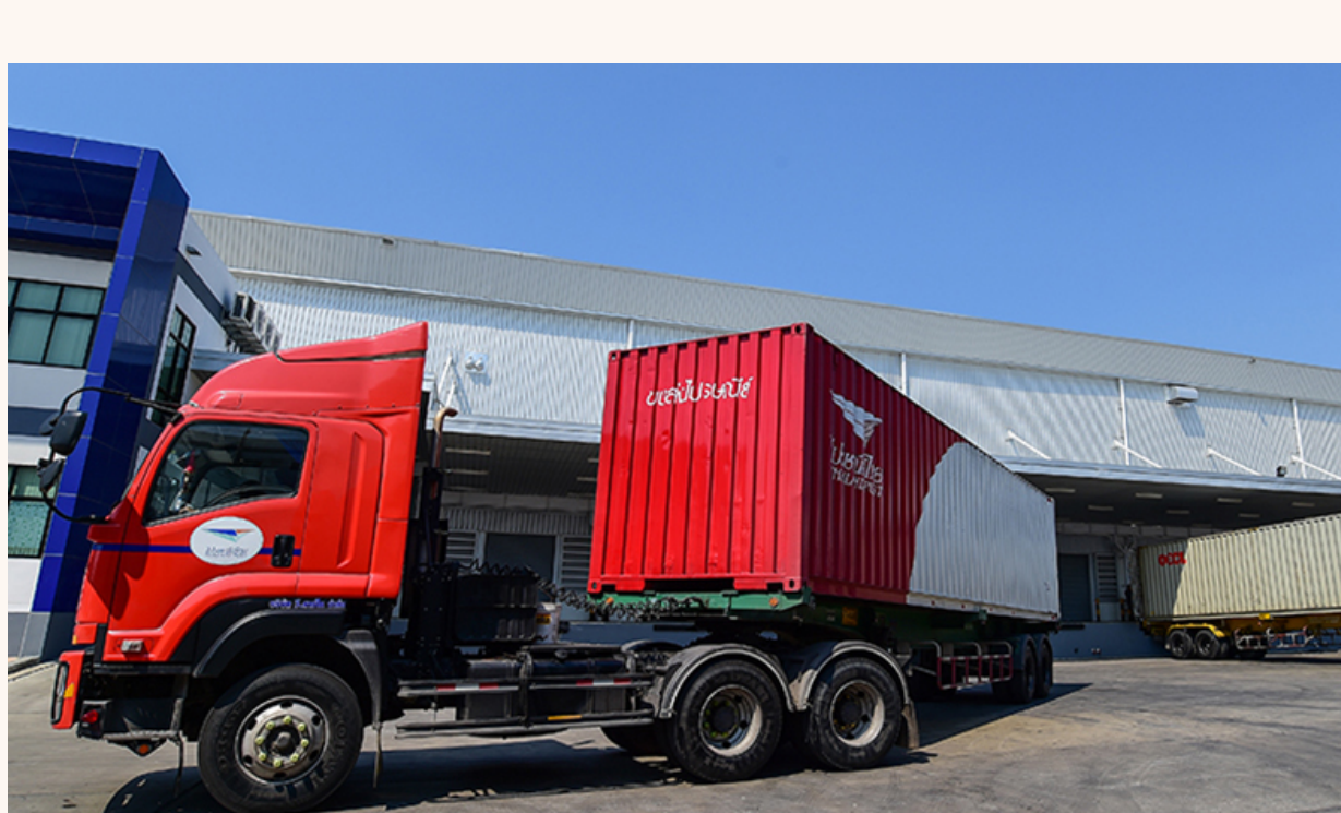
La flota de la empresa está compuesta por los vehículos de diferentes tipos desde camionetas hasta remolques de 18 ruedas