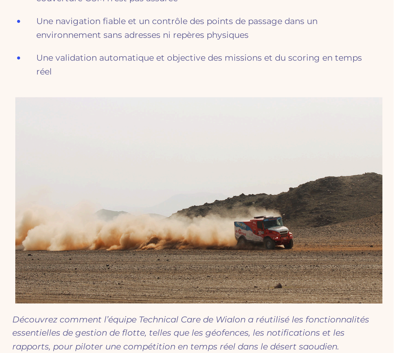
The Wialon Challenge Dakar participants

Wialon a servi de colonne vertébrale technique à l'ensemble de l'événement : suivi des véhicules, sécurité et validation automatique des résultats des missions en temps réel.