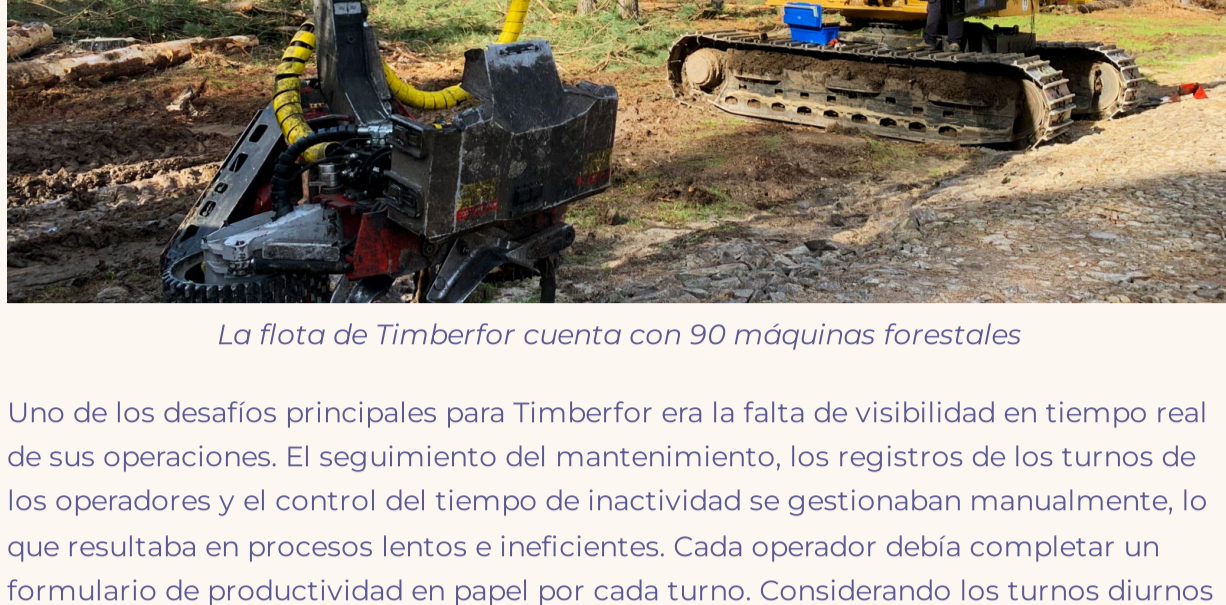
La flota de Timberfor cuenta con 90 máquinas forestales

Timberfor es uno de los proveedores de servicios forestales más grandes de Uruguay, especializado en la gestión forestal maderera, la explotación forestal y el transporte de madera. Opera una flota de 90 máquinas forestales (cosechadoras, autocargadores, taladoras y excavadoras) distribuidas en aproximadamente 15 emplazamientos rurales. En estas áreas, la conectividad a internet suele ser inestable o limitada.