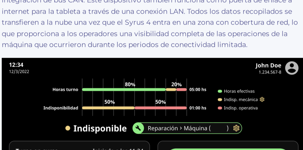
Configuración de dispositivos en cabina

En cuanto al hardware, en la cabina de cada máquina se instaló una tableta Android resistente, especialmente diseñada para su uso en vehículos.