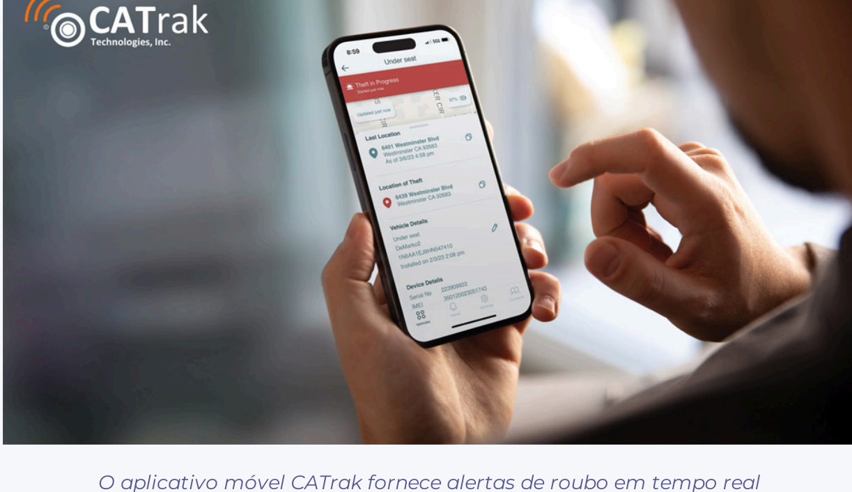
O aplicativo móvel CATrak fornece alertas de roubo em tempo real

A solução une rastreamento GPS com detecção imediata de roubo. Se o sistema de escapamento for adulterado, um forte alarme autônomo de 140 dB que opera independentemente do sistema de segurança principal do carro é acionado para alertar sobre os criminosos. Além disso, mensagens SMS e notificações push dão alertas sobre o furto em tempo real, seguidos por atualizações a cada 30 segundos com uma coordenada de GPS para informar a localização do veículo. Os usuários podem personalizar ações de alerta para aumentar a segurança e garantir uma resposta rápida. As notificações, por exemplo, podem ser enviadas para uma empresa de segurança privada, autoridades locais, para os proprietários dos veículos, gerentes de frotas ou equipes de despacho.